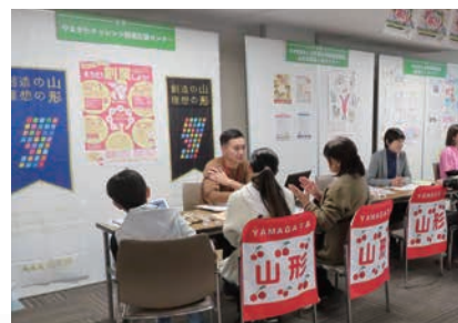
やまがた暮らし大相談会