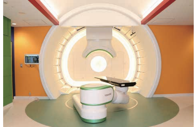
回転ガントリー照射室

地域の福祉向上・発展に貢献するため、山形大学が設置を進めている次世代型医療用重粒子線照射装置（重粒子線がん治療装置）に係る研究開発事業に対し、平成27年度より5年間にわたり総額10億円の交付を行いました。