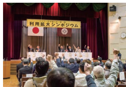
フラワー長井線利用拡大協議会事業