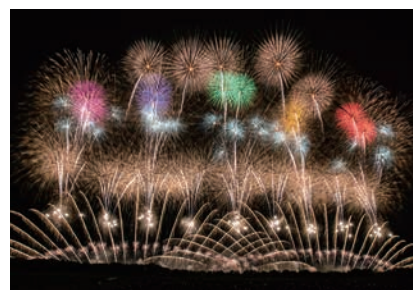
赤川花火大会支援事業