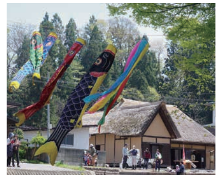
上山市／櫛下宿庄内屋茅葺屋根改修事業