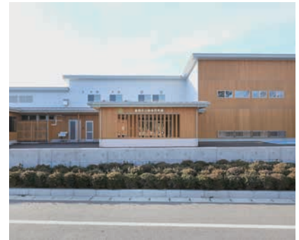
鶴岡市／公立保育園移転改築事業