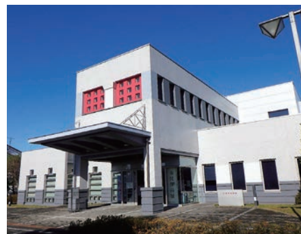
天童市／美術館改修