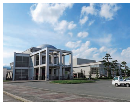
河北町／サハトベに花改修