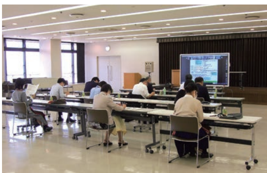
山形県都市監査委員会