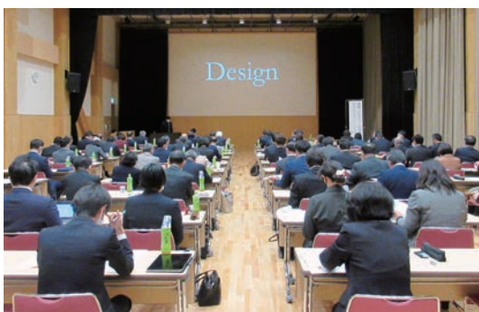
山形県市議会議長会

山形県市議会議長会、山形県町村議会議長会、山形県都市監査委員会及び山形県町村監査委員協議会が行う各種研修事業に対し、助成金を交付しています。