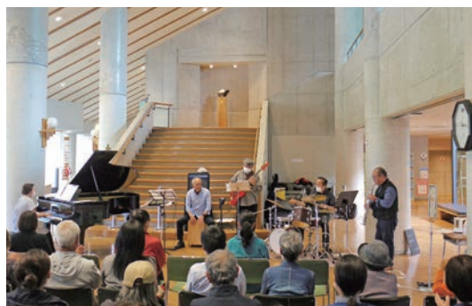
川西町／フレンドリープラザ自主事業