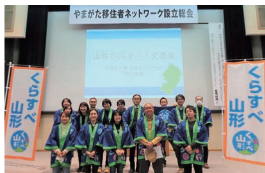
やまがた移住者ネットワーク設立総会 (山形市・山形ビッグウイング)