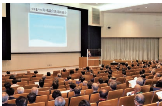
山形県町村議会議長会