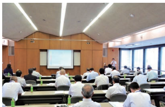
山形県町村監査委員協議会