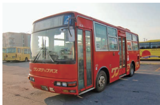
圏域内バス路線運行支援事業