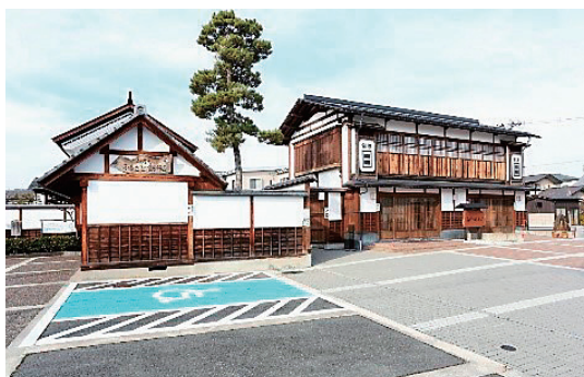
山辺町／ふるさと資料館管理運営事業

ハロウィンジャンボ宝くじ等の収益金を、環境対策、芸術文化の振興、少子高齢化対策等のソフト事業を支援するため、すべての市町村に交付しています。