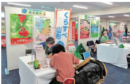
くらすべ山形！移住・交流フェア (有楽町・東京交通会館)

県・市町村・企業・大学等のオール山形で移住定住・人材確保策を一体的に推進する体制の構築に向けた取組みに対して、助成金を交付しています。