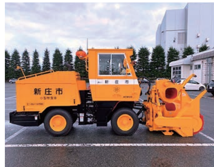
新庄市／ロータリー除雪車購入